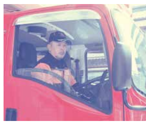
消防車は劇中に何度も登場した。

第一話で撮影した火災のシーンです。火災現場に消防車で向って放水する一連の流れは数カットに分けて撮影するのが一般的なようですが、このドラマではワンカットの撮影に挑戦していました。消防団員で一連の流れをスムーズに行うのは難しいですし、リハーサルでも失敗ばかりで成功は0。しかし本番では見事に3分超えのワンカットを成功させた聞いて、とても驚きました。