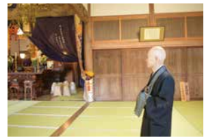
寄進札についての話をする住職。

ウクライナ戦争や能登半島地震など大変なニュースが報じられる中、明るい話題が提供できてよかったです。50年ほど前に陽雲寺に勉強にきていた東大の学生だった方がドラマをきっかけに、来訪してくれました。また、若者が本堂で撮影している光景を多く見ます。お寺は人が亡くなったときに訪れる機会が多いのですが、本来は人を元気づける役割もあると思うので、この撮影をきっかけに多くの人が訪れてくれるのはうれしいです。